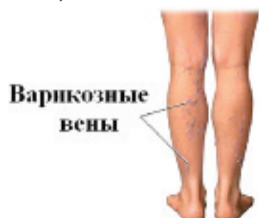
Медицинский центр «Надежда плюс-1» г. Череповец, ул. Ломоносова, дом 4. Телефоны регистратуры: 54-09-09, 22-66-06, 22-62-12

Дополнительную информацию Вы можете получить в регистратуре нашего Центра по телефонам: